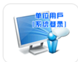
网上业务系统月缴存额上限调整