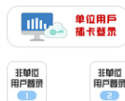
网页版本全程月缴存额上限调整